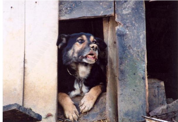
Zdiagnozowany w 2012 r. w pow. rzeszowskim przypadek wścieklizny u psa (postać szalowa)

Wyróżnia się 2 postaci choroby: agresywną (szałową) i cichą (porażenną).